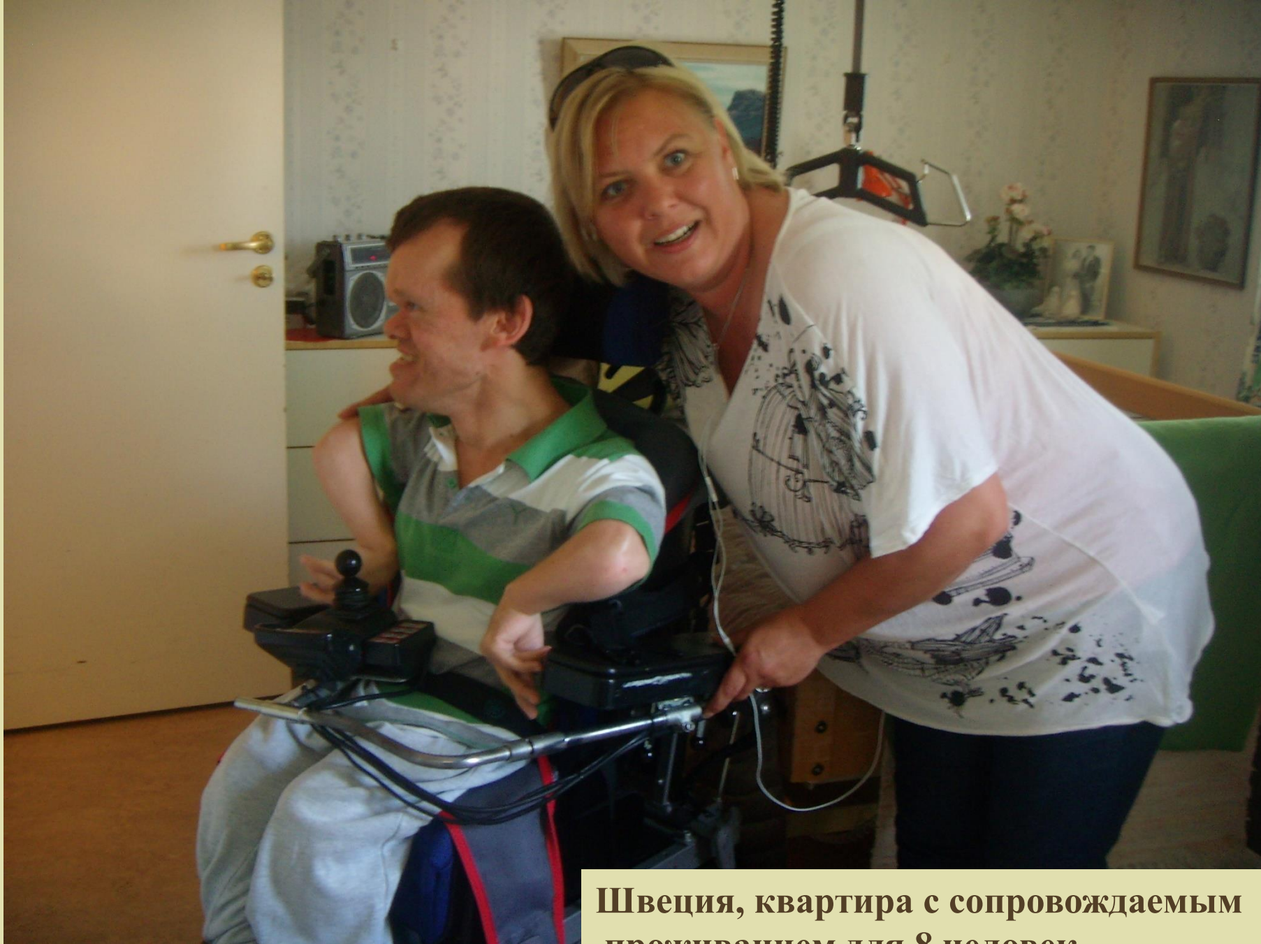
Швеция, квартира с сопровождаемым проживанием для 8 человек,