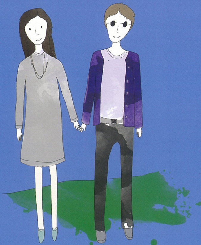
Равенство мужчин и женщин