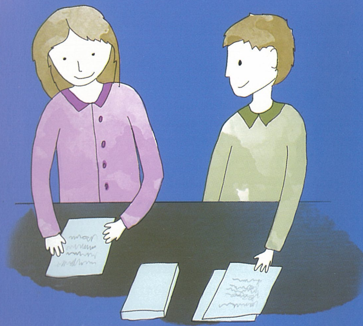
Уважение развивающихся способностей детей-инвалидов и уважение права детей-инвалидов сохранять свою индивидуальность